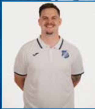
Tobias Geiser Videograf