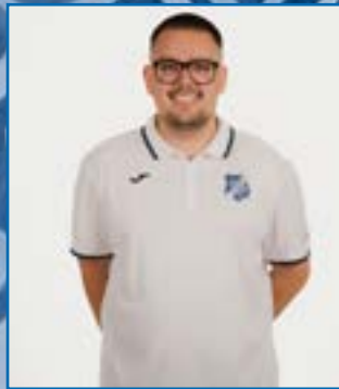
Maximilian Höck Fotograf