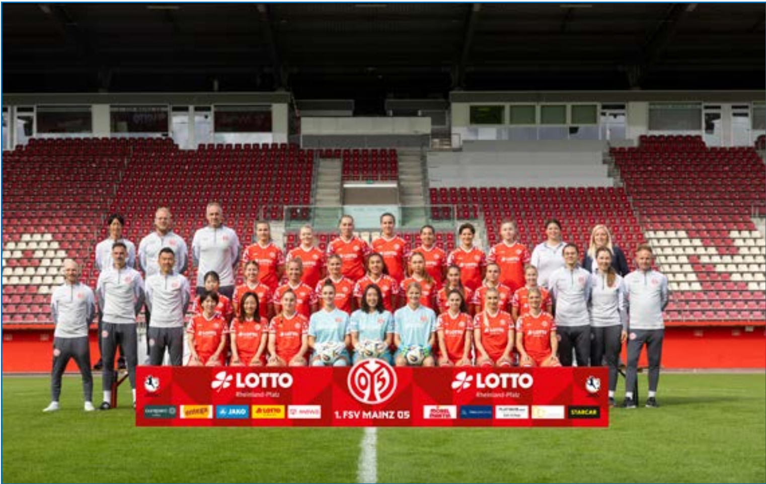
FOTO 1. FSV Mainz 05