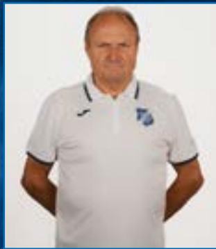
Raymond Klein Marketing